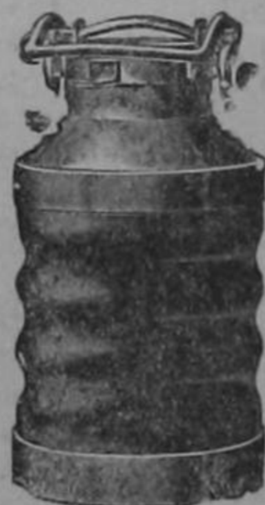
Pinturas Alabastin etc.

Inodoros de porcelana de magnífica calidad Ofrece a sus clientes, esculturas de mármol para cementerios Cemento fresco a $ 17.50 el barril