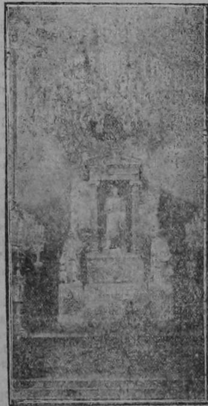
Panteón Nacional bajo cuya cripta se conservan en una riquísima urna de oro los restos del Libertador

Pero entre la soberbia omnipotencia de Bolívar y la admirable unidad de conducta de San Mar-