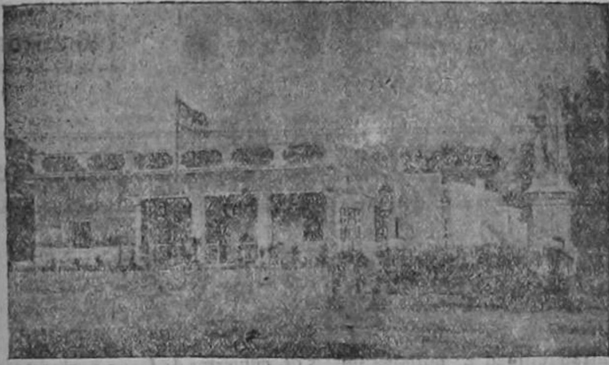
HACIENDA SANTA MARTA Casa en que murió el Libertador a la 1 de la tarde del 17 de diciembre de 1830

Semejante a aquel río de los trópicos, el mayor del universo, que cuando sale de madre en las súbitas creces del verano, baña en un solo día comarcas tan vastas que formarían por sí solas un dilatado imperio, y arrastra en sus hinchados turbiones los bosques como deleznable yerba, y se desborda por las cimas de las montañas que comprimen su cauce, Bolívar, hijo del Amazonas, desciende desde las montañas del Aragua, e inunda de bayonetas todos los valles de la América que aclaman sus victorias.